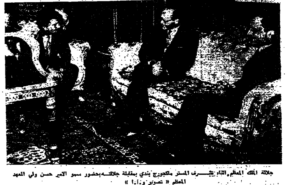
جلالة الملك المعظم الثاني - يشرف الملك فهد بندي بمقابلة جلالتهم بحضور سمو الامير حسن ولي العهد المعظم ( تصوير و.أ.أ )

بغداد - أصدر مجلس قيادة الثورة العراقية بلاناً في ساعة متأخرة من مساء امس سيجح بوجهه بالتجول في كافة انحاء الجمهورية العراقية من الساعة الخامسة صباحاً حتى الساعة العاشرة مساءً وذلك اعتباراً من اليوم وحتى اشعار آخر .